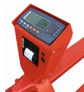
indicator 420 met